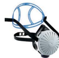
Dräger X-plore® 2100 Maskenkörper aus komfortablem Silikon.