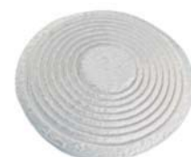
Dräger X-plore® 2100 Maskenkörper aus EPDM